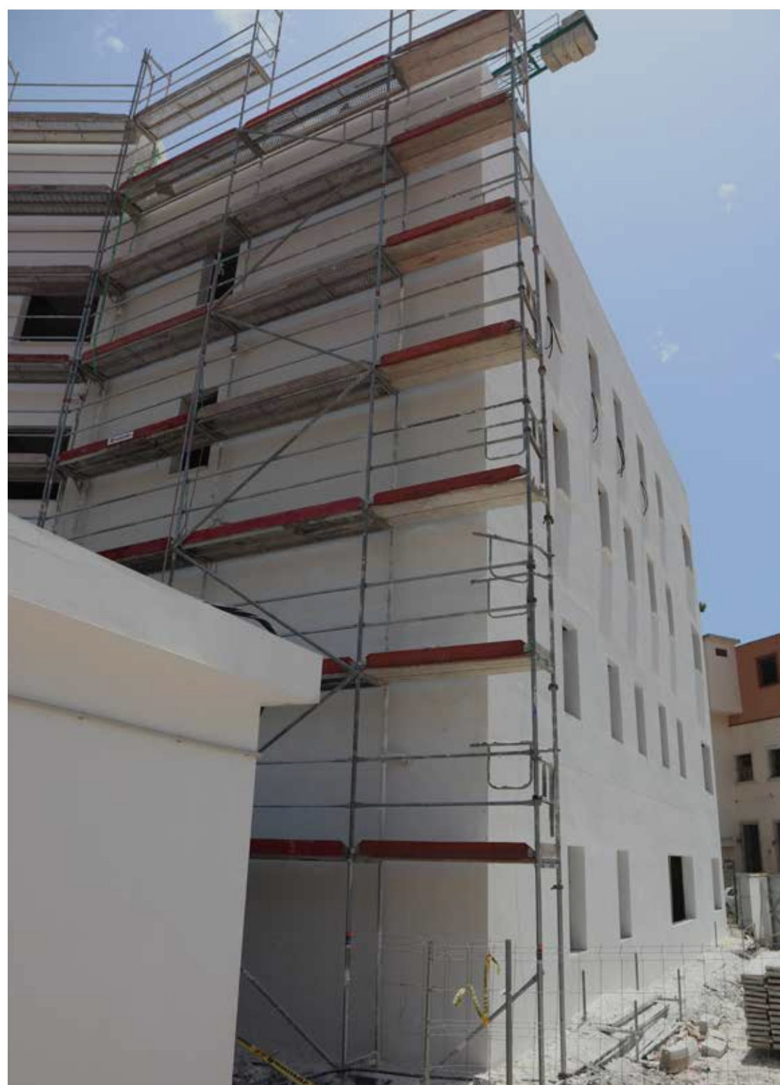
Nuevo centro integral para personas sin hogar en La Línea de la Concepción (Cádiz)

Lamentablemente, la falta de acuerdos entre las distintas administraciones para crear unas condiciones idóneas que garanticen este derecho y las políticas de algunos para que la vivienda se convierta en un bien con el que enriquecerse han provocado que acceder a un hogar, ya sea de alquiler o a través de la compra, sea una quimera ante la escalada incesante de los precios, sobre todo para los más jóvenes.